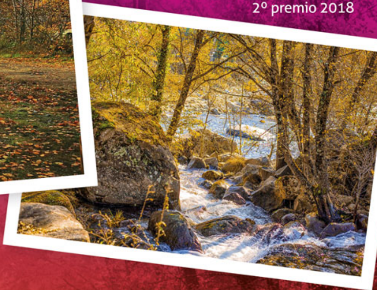
Naturaleza en estado puro 2 o premio 2018

Celebra con nosotros que ¡Porfín! llega el Otoño y disfrútalo mostrándolo en su máximo esplendor